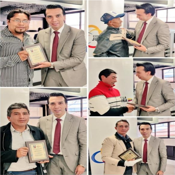
Promoviendo la Cultura de Paz - Carchi