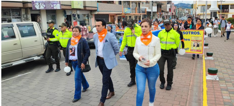
Marcha – Cantón Huaca