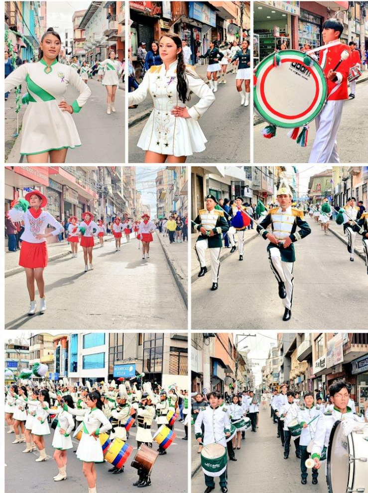
Bandas de Paz